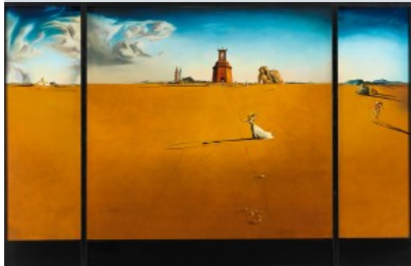
Landschap met touwjespringend meisje