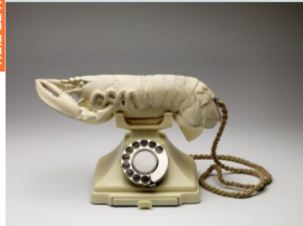
White Aphrodisiac Telephone (Witte lustopwekkende telefoon)