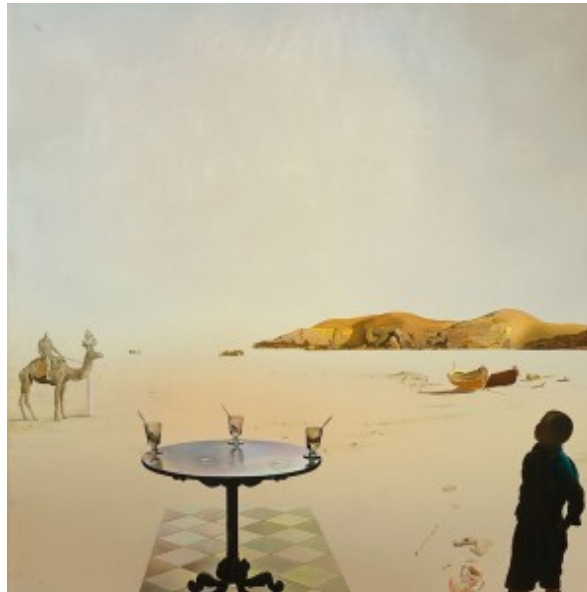
Table solaire (Zonnetafel)