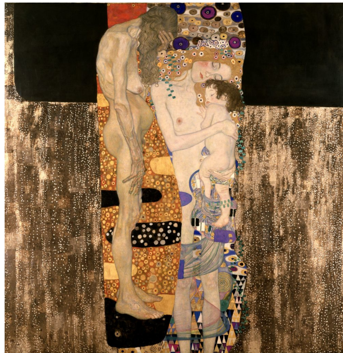
Gustav Klimt Le tre età , 1905